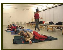
Awareness Through Movement 【動きを通じた気づき】